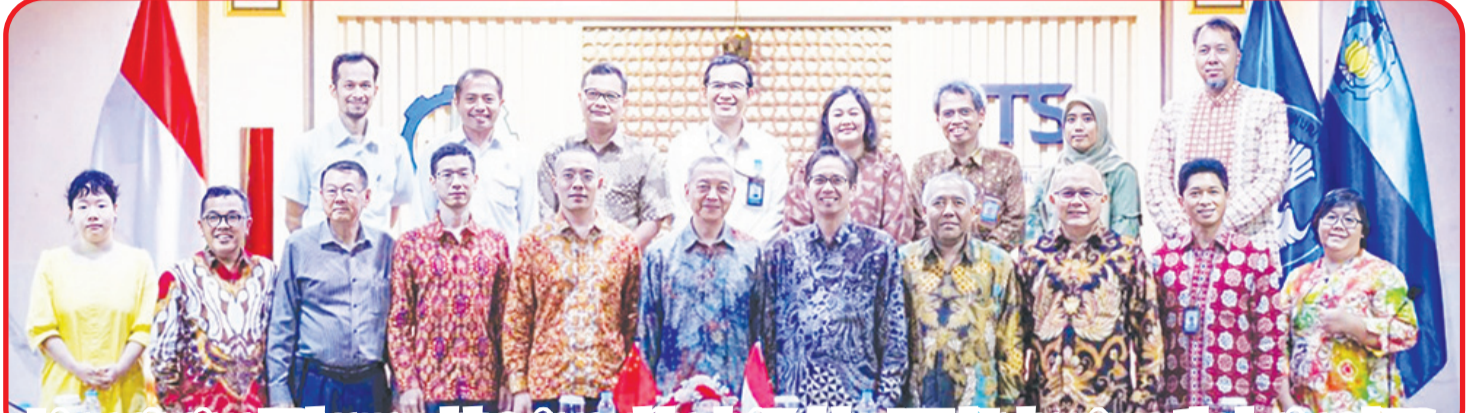
Jajaran pimpinan ITS bersama delegasi perwakilan dari Kedubes RRT di Indonesia, saat berkunjung di ITS.

SURABAYA (IM) - Sebagai World Class University, ITS (Institut Teknologi Sepuluh Nopember) telah banyak menjalin kerja sama dengan berbagai negara di dunia salah satunya dengan Republik Rakyat Tiongkok (RRT). Guna memperkuat kerja sama tersebut, delegasi Kedubes (Kedutaan Besar) RRT di Indonesia mengunjungi ITS, Kamis (8/6), untuk