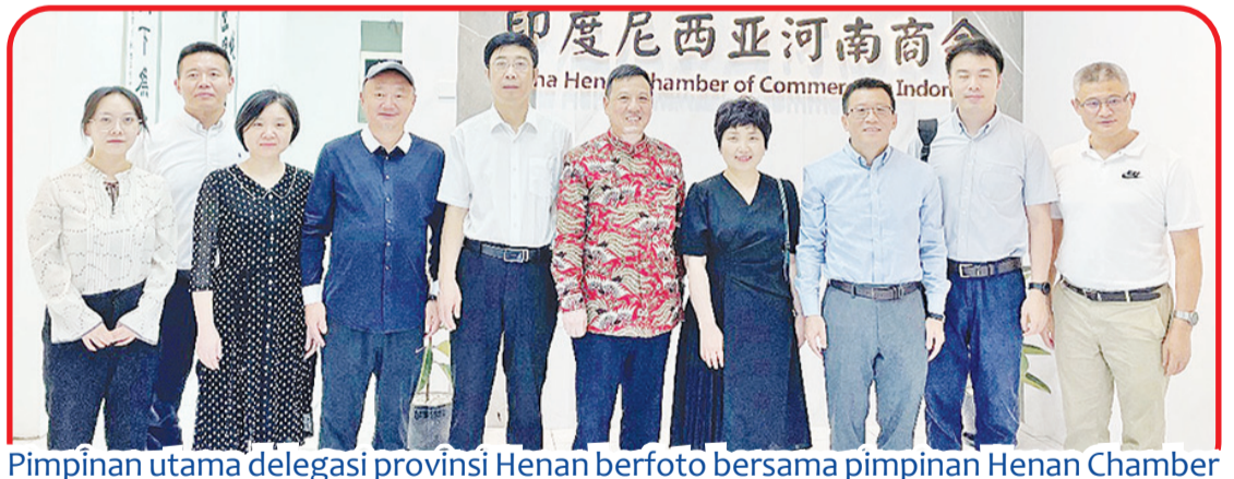
Pimpinan utama delegasi provinsi Henan berfoto bersama pimpinan Henan Chamber of Commerce.

nyak proyek penting yang sedang dilaksanakan oleh unit-unit anggota China Chamber of Commerce in Indonesia. Seiring semakin mendalamnya kerja sama politik dan ekonomi antara kedua negara, maka semakin banyak perusahaan Tiongkok yang meraih sukses di Indonesia. Ini akan menarik lebih banyak perusahaan Tiongkok datang ke Indonesia untuk berkembang. Henan Chamber of Commerce dapat berperan besar mendorong perkembangan perusahaan Henan