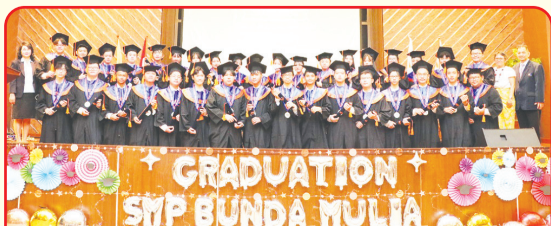
Para siswa lulusan tahun ajaran ini berfoto bersama wali kelas, Kepsek, Kepala Bidang Pengajaran dan tokoh lainnya.

JAKARTA (IM) - Auditorium Sekolah Bunda Mulia, Jakarta, Sabtu (10/6) lalu menyelenggarakan Graduation Day SMP Bunda Mulia.